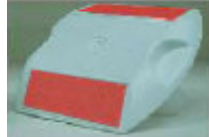
RPM Lensa Merah