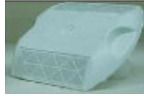
RPM Lensa Putih